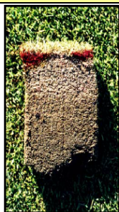
Sólo con agua