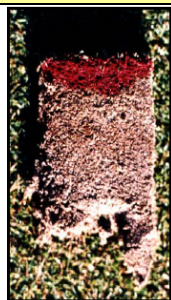
Agente humectante convencional